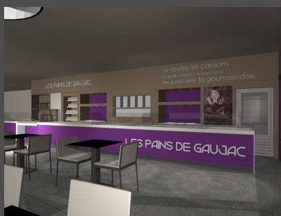
Photo de la réalisation Image 3 D